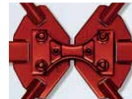
制震フレーム 「ハイパワードクロス」