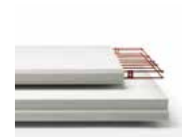
ALCコンクリート 「ヘーベル」