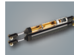
オイルダンパー 制震装置「サイレス」