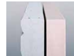
高性能断熱材 「ネオマフォーム」