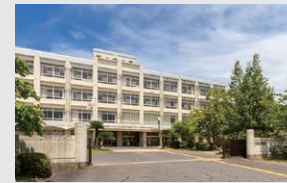
守山市立物部小学校 徒歩15～16分(約1,190～1,260m)