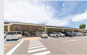
コープもりやま店 徒歩13～14分(約1,020～1,090m)