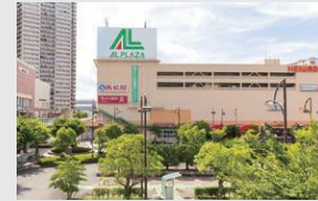
アル・プラザ栗東 徒歩8～9分(約610～670m)