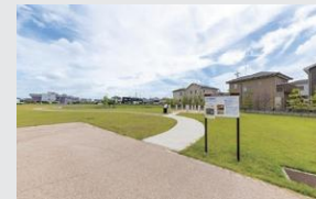
伊勢遺跡史跡公園 徒歩4～5分(約290～330m)