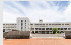
守山市立守山南中学校 徒歩28～29分(約2,220～2,290m)