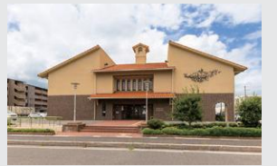
もりの風こども園 徒歩13～14分(約980～1,050m)