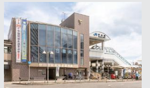
JR琵琶湖線「守山」駅 徒歩21～22分(約1,680～1,750m)