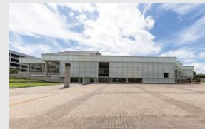
栗東芸術文化会館 さくら 徒歩8分(約580～640m)