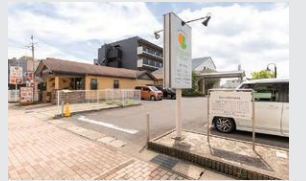
パームこどもクリニック 徒歩11分(約820～880m)